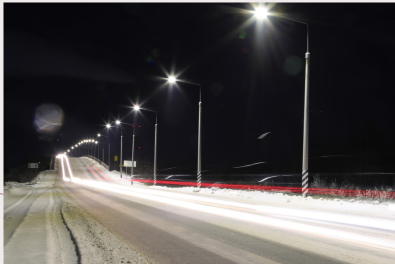
Линии освещения вдоль ул. Окружной