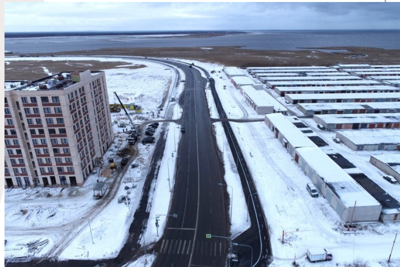
Дороги в квартале 085