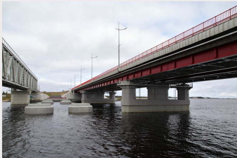
Мост через Никольское устье Северной Двины